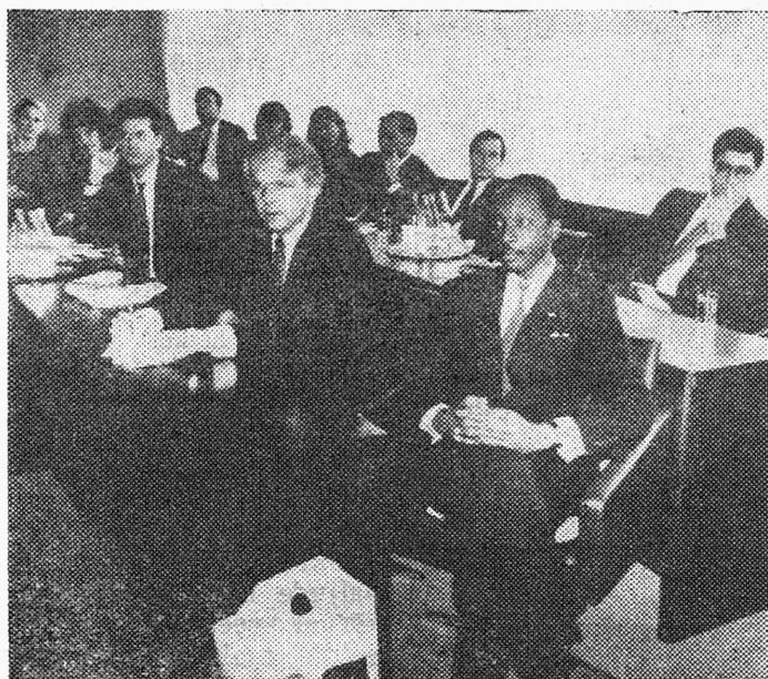
Hetk kohtumiselt õpetatud nõukogu saalis.