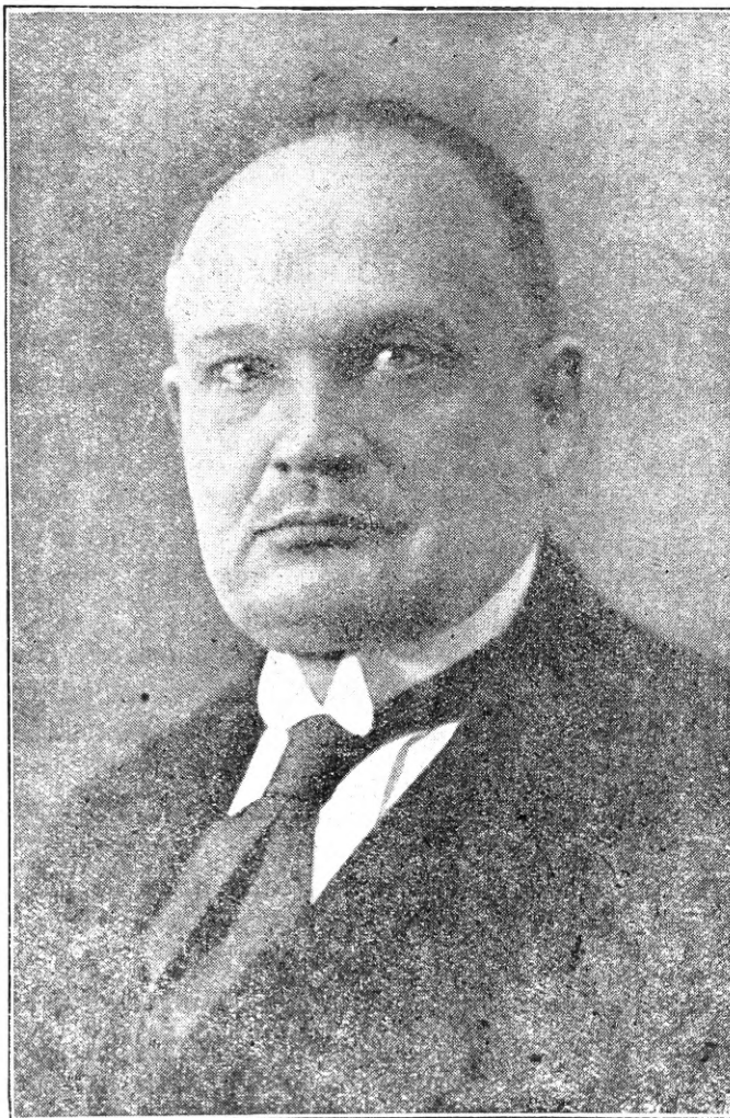
Riigivanem Konstantin Päts.

Mida rohkem lahutavat sisaldab eneses jooksev argipäevaelu, seda rohkem ühendavat pühapäevalikku kostku meile eestrist neisse paljudesse tuhande- sesse kodusesse, mis ku-