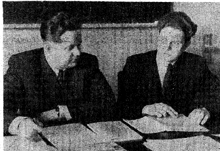
Häid teadmisi näitasid poliitilises ökonomias laevaremonditeaduskonnas rühma L-64 üliõpilased.

Hiljuti toimunud tootmisnõupidamisel kritiseeriti rühmas esinevaid puudusi ja otsustati need enne eksameid likvideerida. Mitmed üliõpilased tegid sellest tõsisel järeldused ja on nüüd võlgnevused likvideerinud, kuid paljudel tuleb viimaste eksamieelseste päevade jooksul veel palju tööd teha, et sooritada arvestused õigeaegselt.