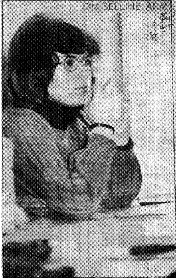
◆ ...ARMASTUS EKSAAMITE VASTU.