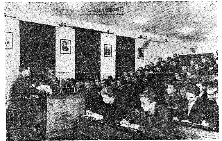
Из аудиторий института лучше всего оборудована аудитория физики. Лекции по физике сопровождаются интересными опытами, что значительно облегчает усвоение предмета.