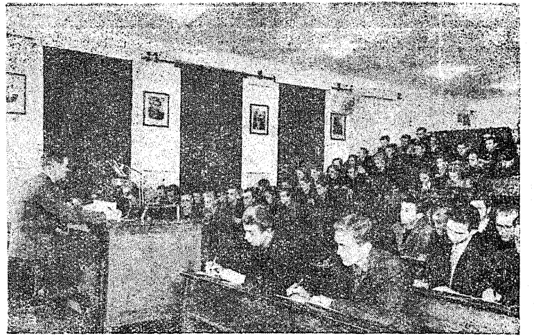
Üheks pareminisisustatud auditooriumiks meie instituudis on füüsika auditoorium. Loengud füüsikas toimuvad käsikäes huvitavate katsetega, mis kergendavad tunduvalt õppeaine omandamist.