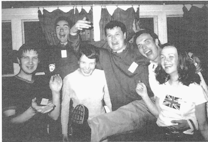
Tehnikaülikooli ärikorralduse magistrid: me oleme olemas

mamoodi arvasid ka teised küsitluses osalenud. Kuigi paljud olid kaalunud õpinguteks ka EBS-i, valiti ikkagi TTÜ, ja see on tähtis.