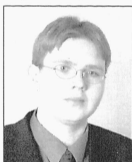
Valter Veedler Mehaanika õppevaldkond