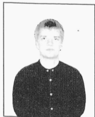
Viljar Mee Informaatika õppevaldkond

Teie ees pildidel on need 14 üliõpilasesinduse uut liiget, kes osutusid valituks aprillis toimunud valimistel. Teised 14 liiget võitlesid oma koha välja eelmisest üliõpilasesinduse koosseisust, sest järjepidevuse huvides on pooltel esinduse liikmetel võimalus jääda teiseks aastaks.