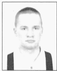
Indrek Kägu Geotehnoloogia õppevaldkond