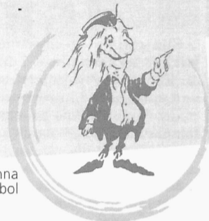
Julius - üliõpilaskonna sümbol