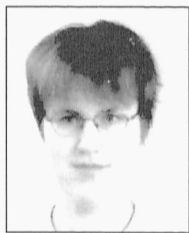
Kadri Saarma Logistika õppevaldkond