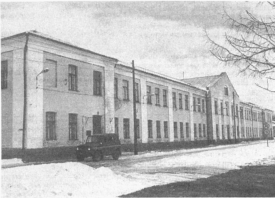
Foto 3 on hoone aadressiga Filtri tee 5, kus a-st 1963 asus eriettevalmistuse kateeder, mis 1990. a ilmunud "TTÜ telefonid" andmetel eksisteeris sõjalise kateedri nime all.