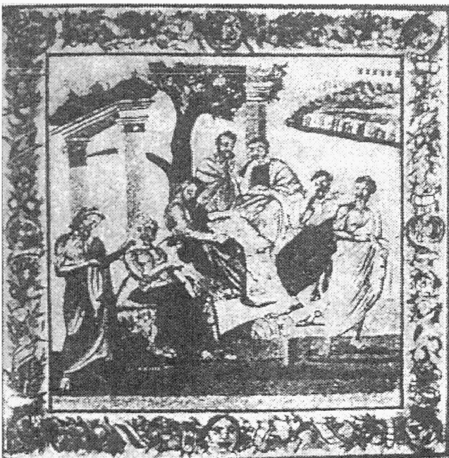
Platon õpilaste keskel. Pompeijast leitud mosaiigifragment.

Antiik-Kreeka mütoloogia rikkalikku tegelaskalorisse kuulusid ka nn heerosed - kanaelased (näit Herakles ja Achilleus). iu-