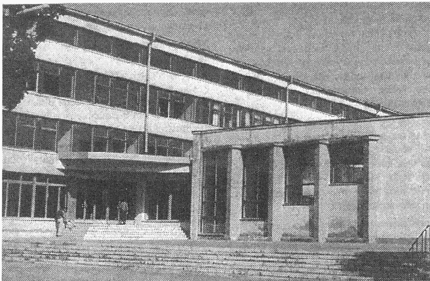
1969. a valmis Kohtla-Järvel TTÜ üldtehnilise teaduskonna hoone (foto 4). Alates 1992. a töötab seal Virumaa Kõrgkool. Peatselt peaks see õppeasutus liituma TTÜ koosseisu kolledzhina.