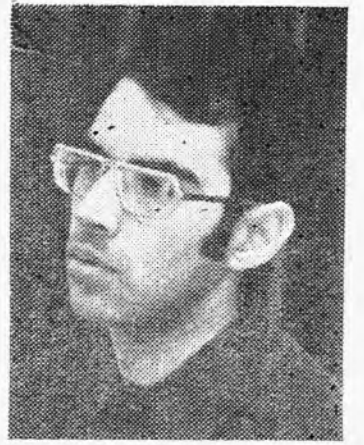
Nõukogude Liidu üliõpilastega.

Organisatsioon osaleb aktiivselt rahvusvahelises noorsoo ja üliõpilaskonna demokraatlikus liikumises, tulemusrikkas on tema koostöö Rahvusvahelise Üliõpilaste Liiduga, samuti kontaktid