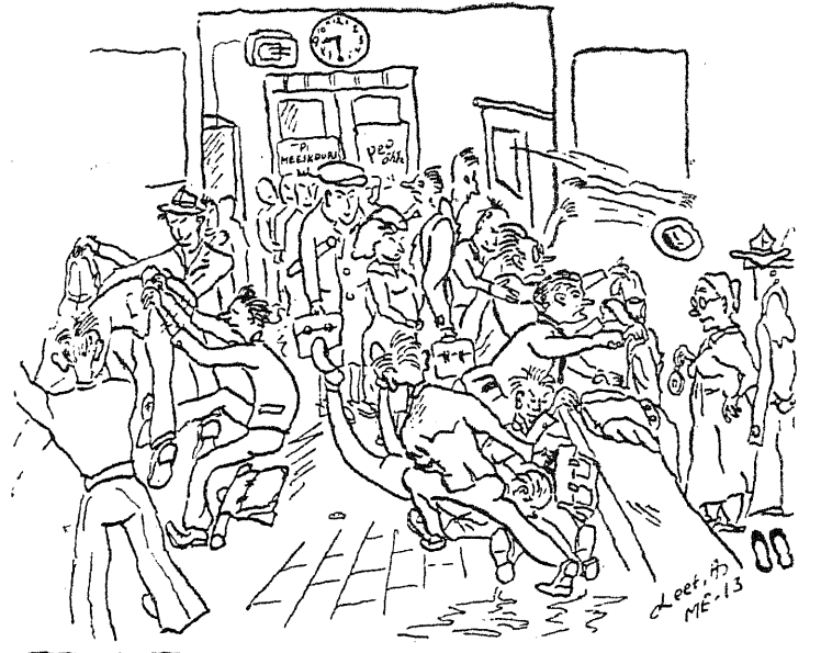
Rüetehoidja: „Kummalised inimesed need üliõpilased — trügivad kõik korraga. Viie minuti pärast taipavad ainult vähesed tulla“