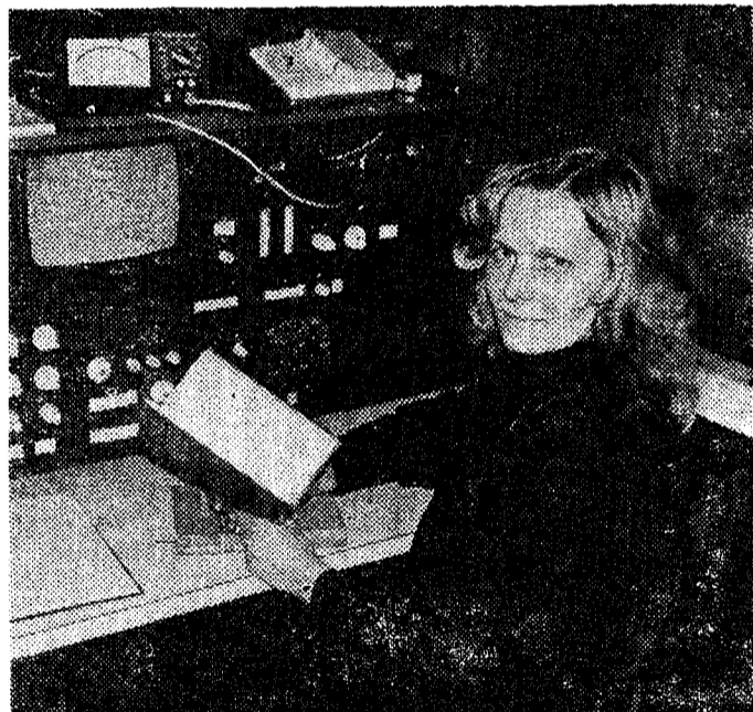
Такой он — электронный микроскоп.

Заказчиков у лаборатории много — как уже отмечалось, все факультеты ТПИ. Много исследований выполняется для