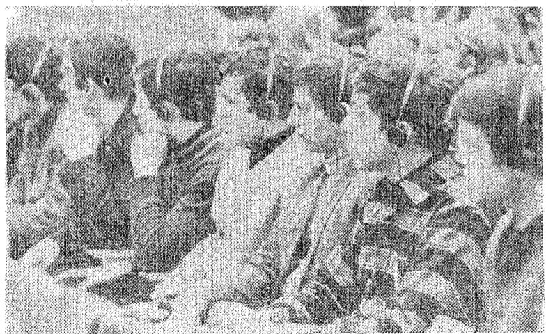
Grupp üliõpilasi Saksa Demokraatlikust Vabariigist.

Vahetati mõtteid kõrgema kooli komsomolitöö probleemidest, tutvuti Tallinna vaatamisväärsustega, käidi vabaõhmuuseumis Rocca al Mare.