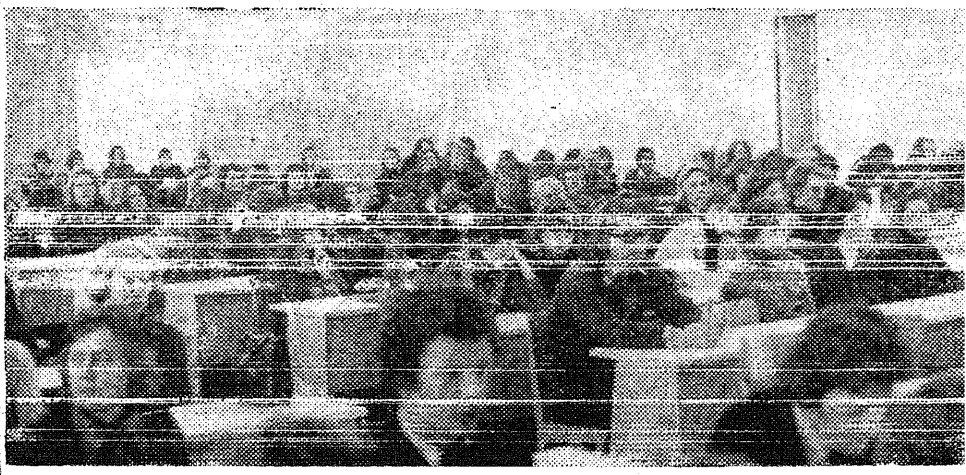
* Kuulajaskond vastses auditoriumis.