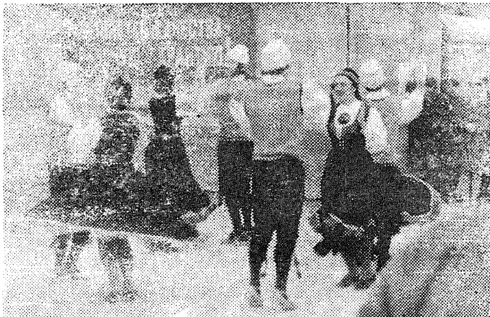
* «Kuljuse» tantsupaarid.

Brjanski oblastis vaataskuulajad meid Navlju sovhoosi töötajad ning Fokino tsemenditehase ehitajad ja töötajad. Meie kontsert algas tavaliselt lühikese Eestit tutvustava loenguga, millele järgnesid vaheldumisi kvartetipoiste laulud ja meie tantsud. Eriti hästi võeti muidugi vastu vene rahvalaulud ja vene tants. Ka särtsakamad eesti tantsud meeldisid.