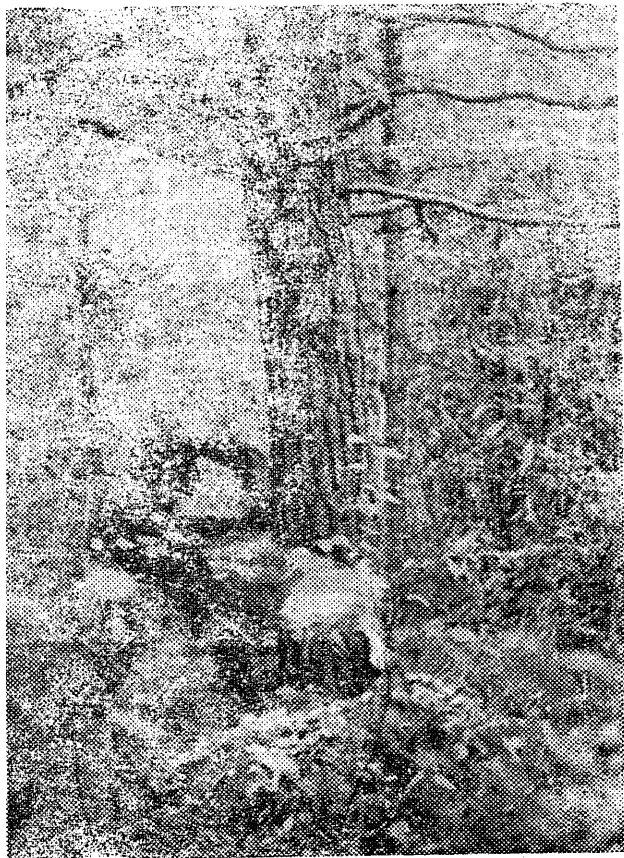
Kas saab puu maha? Aega läks küll oma pool tund, aga kui kange mees asja ette võtab, siis kaua sel puulgi kangust enam on! Foto: Heiki Vaher (LS-51)

Kuigi 1. september on tavalliselt esimeseks koolipäevaks, põlnud ta paljudele meie instituudi tudengitele veel märguandeks õppetöö alguse kohta.