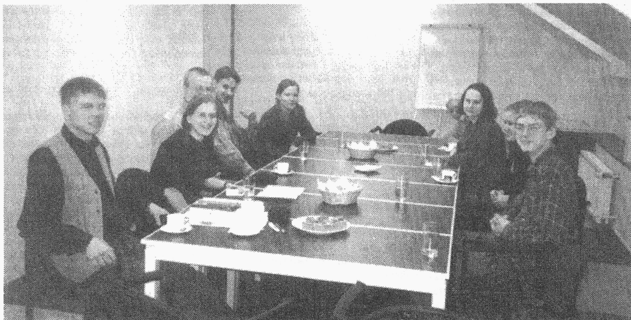
Kohtuvad Kuressaares: vasakul üliõpilasesindus, paremal kolledzhi üliõpilased.