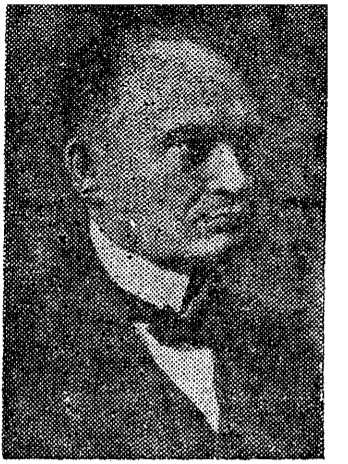
Президент Эстонской республики К. Пятс.