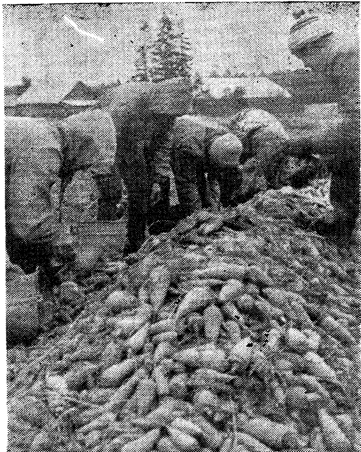
◆ Porgand, porgandi, porgandit... palju porgandeid, hommikul porgand, pealelõunal porgand... ja nii kaks nädalat jutti.