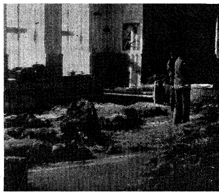
◆ Eks ole, peaaegu nagu Pompeij? Tegelikult M-tudengite magala Veneveres.

Nüüd lõpuks hakkab selleaastase saagi päästmise aktsioon lõppema. III kursus asus õpingute juurde juba 2. oktoobrist, teised on tagasi jõudnud või jõudmas kes kunas. Viimased tulevad sel nädalavahetusel.