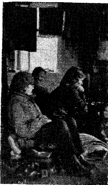
◆ Nii istuti pärast lõunasööki oma kodinate all, peal ja vahel.