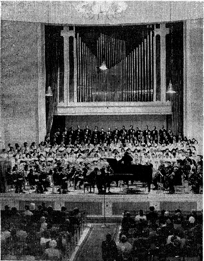
◆ L. van Beethoveni «Fantaasia klaverile, koorile ja orkestrile» «Estonia» kontserdisaalis 14. veebruaril 1971. aastal.