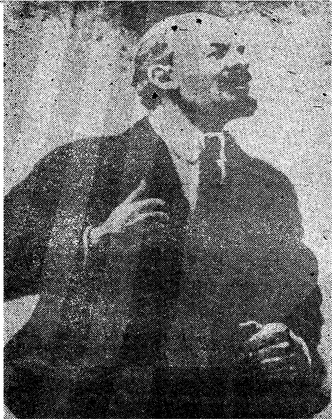
22. APRILLIL ON V. I. LENINI 114. SÜNNI- AASTAPÄEV