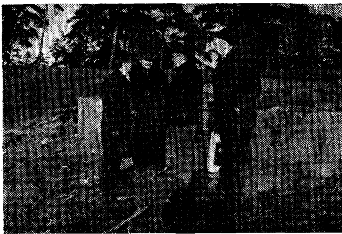
Projekti autorid, artikli autor ja ehitusjuht olukorraga tutvumas.