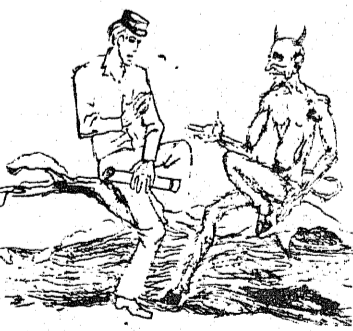
Рис. Г. Лившица, АВ-17.

— Ваше дьявольство, как вы относитесь к людям? — Как к самому себе. — Какие недостатки вы видите у бога? — Он весь состоит из недостатков... Да и живет на небесах. Согласитесь со мной, что с небес легче упасть на землю и сломать себе шею.