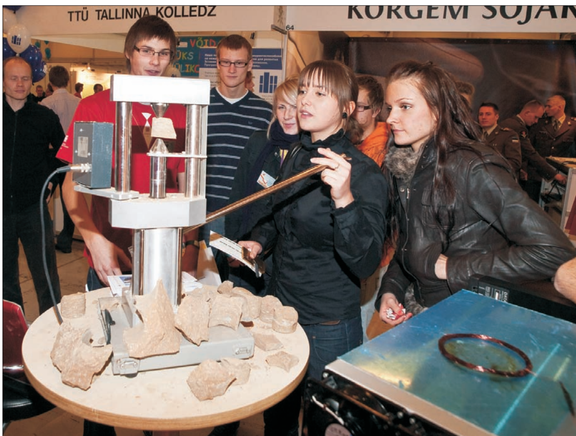
3.-5. detsembrini osales Tallinna Tehnikaülikool taas populaarsel noorte infomesil Teeviit. Mess on mõeldud gümnaasiuminoortele, kes on tegemas kaalukat otsust, kuhu õppima asuda ja millist eriala valida. Sel aastal olid TTÜ boksis kavas tudengikasvatuse tunnid, näiteks ühikaeluõpetuses, kuidas efektiivselt kartuleid koorida või tugevusõpetuses – naisekandmine ja palju muud põnevat. Laval esines ka TTÜ infotehnoloogiaeaduskonna raju bänd Surakas.