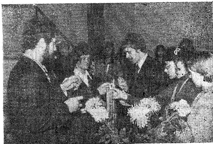
Moment küünalde süütamiselt — rektori pidulik vastuvõtt sotsialistliku võistluse võitjatele ja parimatele õppuritele oli Taidelejae Majas 17. novembril.