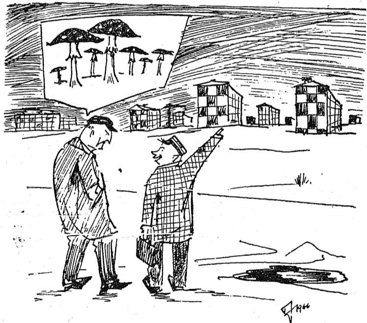
«Majad kerkivad nagu seened!»