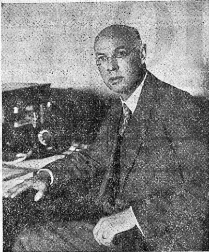
Läti ringhäälingu juhataja A. Smilga oma kabinetis.

nistusse. Seejuures leiavad täitmist ka kõik ringhäälingu-kuulajate erisooovid, kui nad pole vastolus raadioasjanduse põhimõtetega.