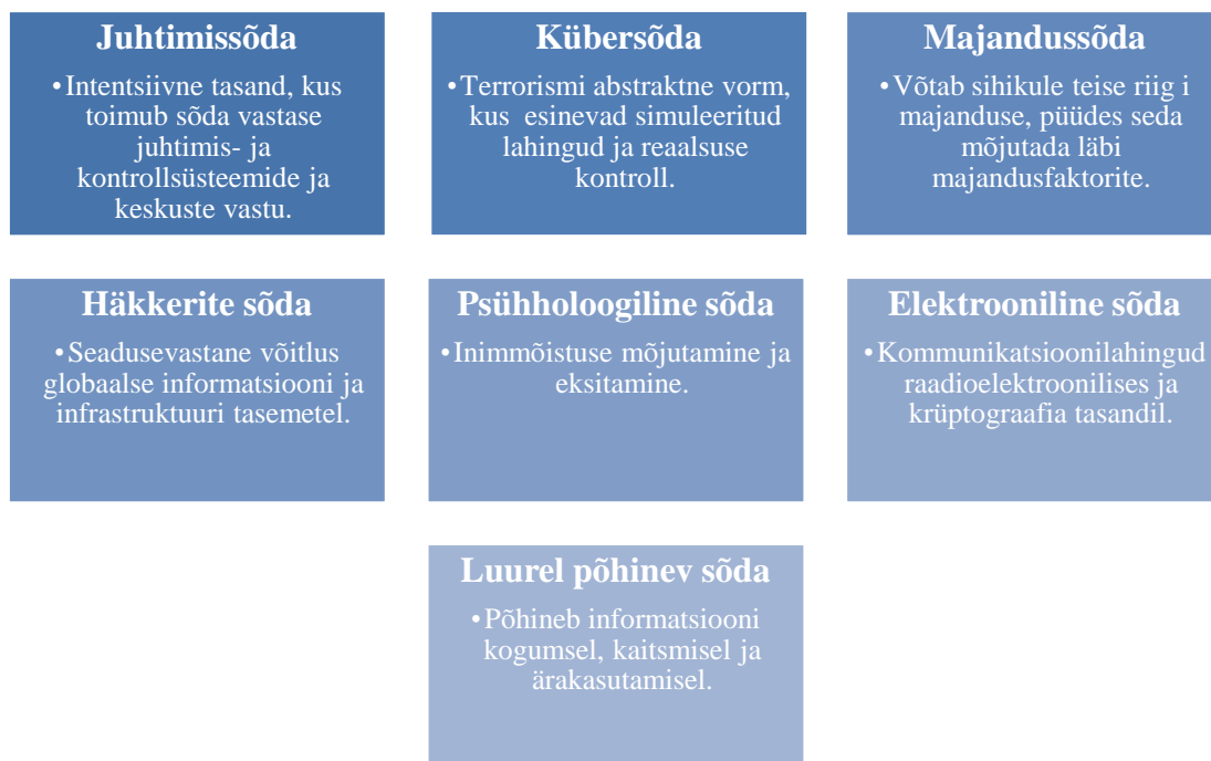
Joonis 1. Allikas Mägi/ Vitsut 2008

Autori hinnangul on infosõda mõistena koguaeg muutuses, ning seetõttu on väga raske välja tuua seitset kindlalt vormi. Tihtilugu need segunevad ja on raske aru saada, millega täpselt tegu. Näiteks arvan, et kübersõda ja häkkerisõda on paljustki segunenud ja tihti kasutatakse nende mõlema jaoks üldist terminit kübersõda. Samuti saab autori hinnangul toimuda korraga näiteks majanduslik infosõda kui ka elektrooniline sõda.