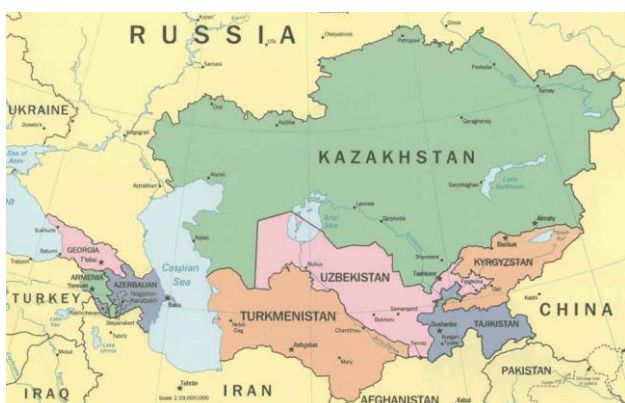
Рисунок 1. Центральная Азия.

Регион Центральной Азии является большой территорией, которая расположена в центральной части Евразии. В данный регион входят: государство Таджикистан,